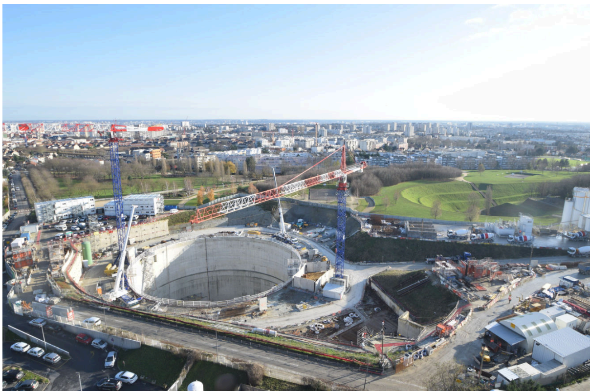
Chantier de la future gare de Villejuif IGR

Au programme de cet événement : un spectacle pyrotechnique créé par Groupe F, une mise en lumière artistique du puits, un live musical de Jaffna, une installation de l'artiste Iván Navarro et l'exposition « archéologie du futur » plongeront les participants dans une ambiance festive et artistique. Les plus jeunes profiteront également des ateliers jeunesse, sans oublier le traditionnel gigot bitume offert à tous !