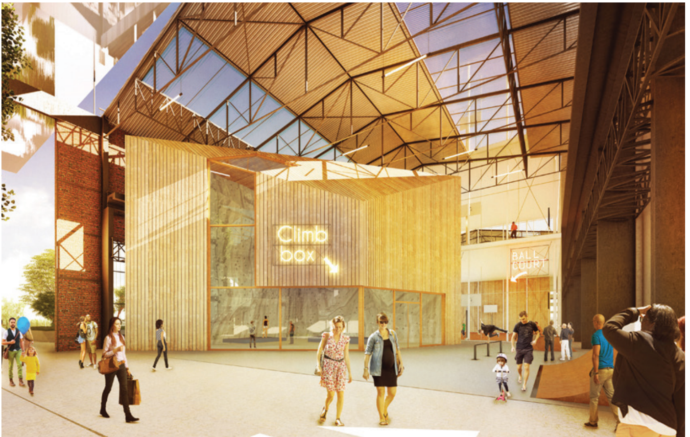
halle des cultures urbaines©Dominique Perrault Architecte_adagp