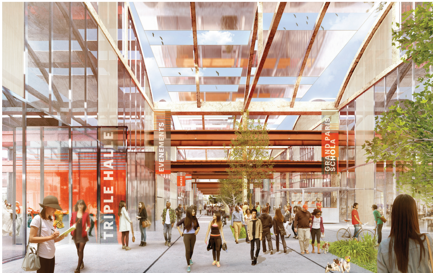
passage Babcock©Dominique Perrault Architecte_adagp

Restructuration des Halles Babcock, La Courneuve