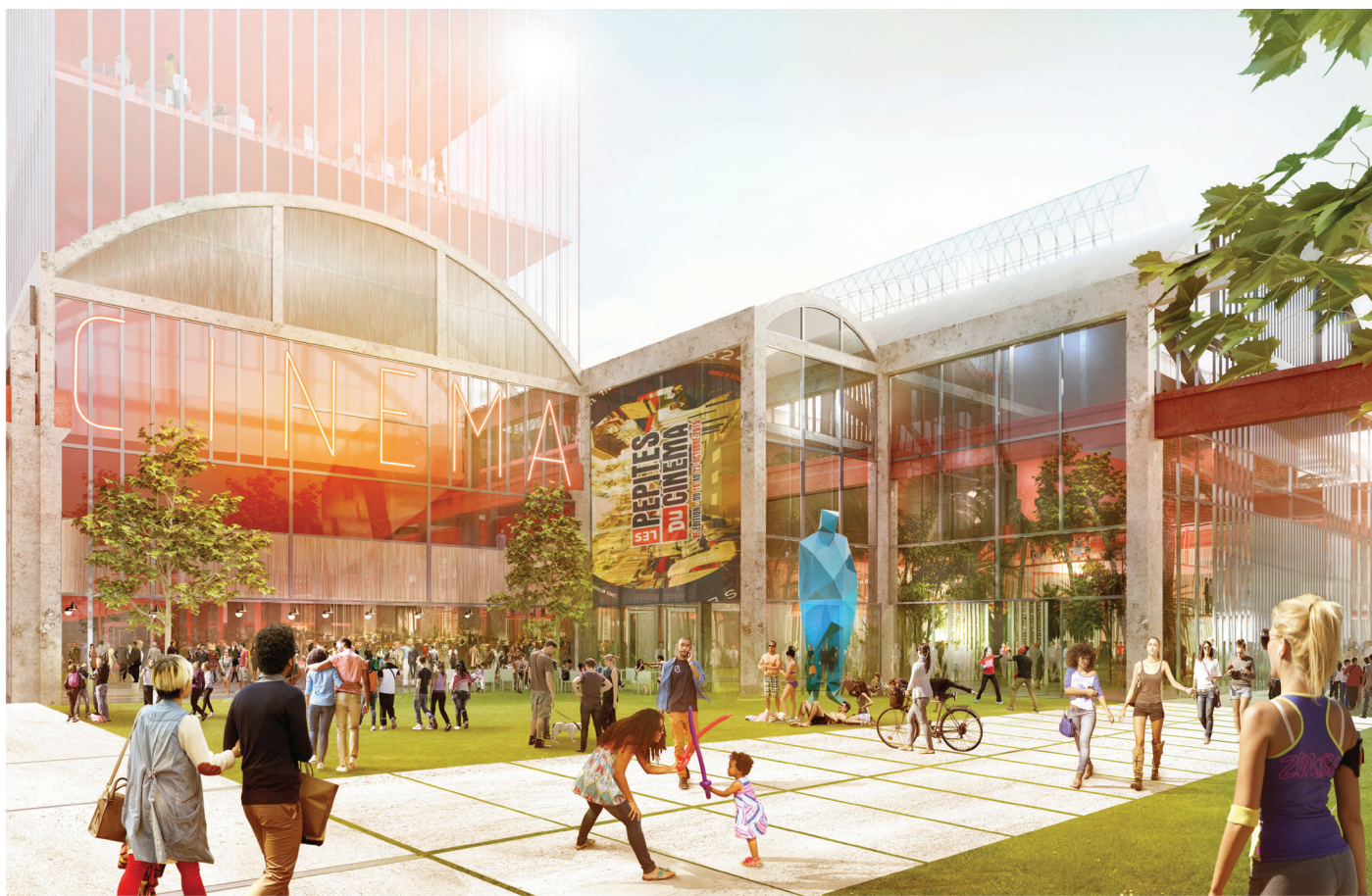
le jardin du cinéma©Dominique Perrault Architecte_adagp

Restructuration des Halles Babcock, La Courneuve