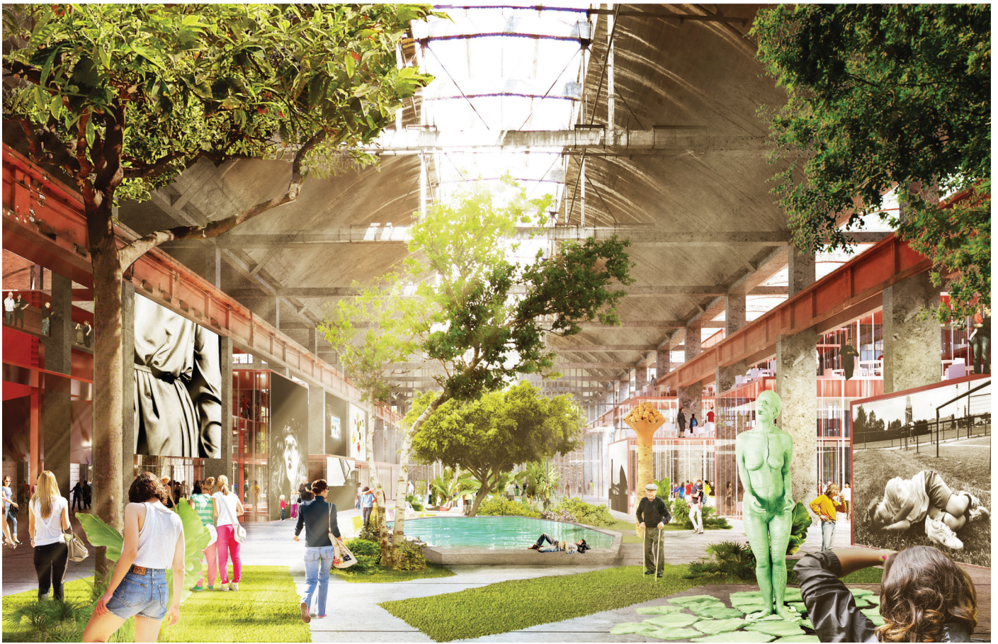
la serre culturelle©Dominique Perrault Architecte_adagp

Restructuration des Halles Babcock, La Courneuve